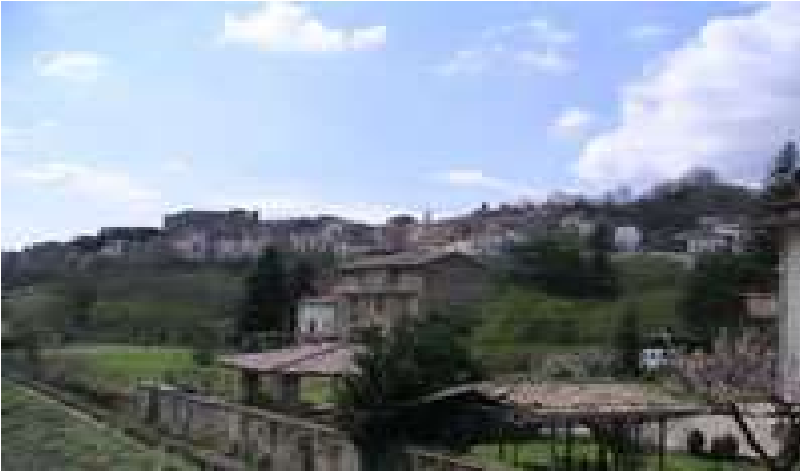
Immagine di Prata P. U.